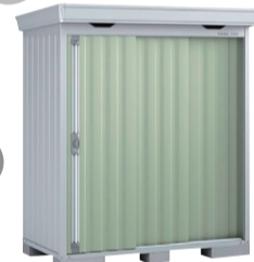
イナバ物置FS 1809S 物件に設置いたします ※ご成約時に色をお選びいただけます