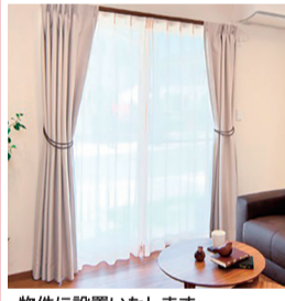
物件に設置いたします