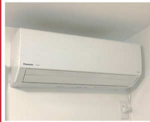
Panasonic Jシリーズ 8帖用 物件に設置いたします