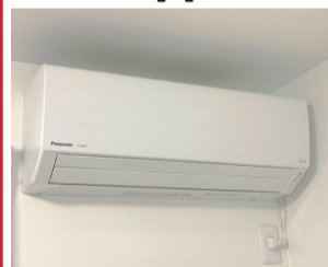
Panasonic Jシリーズ 8帖用 物件に設置いたします